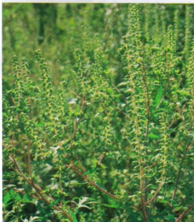
Žvrklja ( Ambrosia artemisiifolia L.)