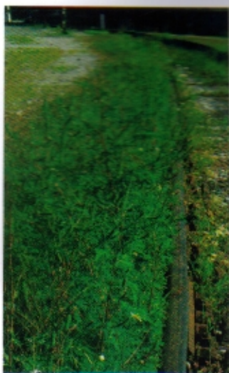
Tudi ruderalna rastišča, kot so železniške proge, žvrklji omogočajo, da zarašča vedno večja območja.