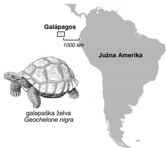
galapaška želva Geochelone nigra

Odgovora napiši na ocenjevalno polo. (4 točke)