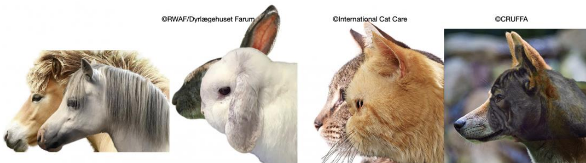
Fotografije brahiocefaličnih živali nad fotografijami »običajnih« živali, nakazujejo, kako zelo smo ljudje spremenili njihovo obrazno morfologijo

Predavanje je nadaljeval s tematiko o človekovem sebičnem poseganju v naravo, katero spreminja in oblikuje po svojih idealih. Tukaj je v ospredje postavil dobro poznane brahicefalične oz. kratkogobčne pasme s topim gobcem, okroglo in veliko glavo, ter okroglimi široko razmaknjenimi očmi. Mednje npr. štejemo mopsa, francoskega in angleškega buldoga ter bostonskega. »Obrazi« teh pasem naj bi človeka spominjale na otroka, kar je ljudem nagonsko všeč – takšne živali se nam zdijo ljubke in prisrčne. Vendar se za tem »ljubkim« videzom skrivajo marsikateri zdravstveni težave, od katerih je najpogostejši t.i. brahicefalični sindrom, poleg njega pa se pojavljajo še razne kožne težave, alergije, težave s spanjem, smrčanjem, bruhanje in druge gastrointestinalne težave, težave z očmi, nevrološke in reprodukcijske težave... Te težave izvirajo že iz same vzreje, saj na prvo mesto nista postavljeni dobrobit živali in njihovo zdravstveno stanje, temveč je selektivno parjenje usmerjeno predvsem na videz živali.